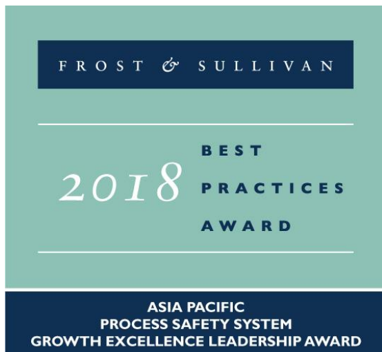
Bild: HIMA erhält von Frost & Sullivan den Growth Excellence Leadership Award für die Region Asien-Pazifik in der Kategorie „Safety-Systeme in der Prozessindustrie“.